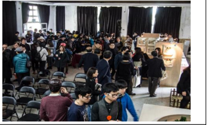
「課程與實務整合教學成果展」-業師協同教學課程成果展開幕式