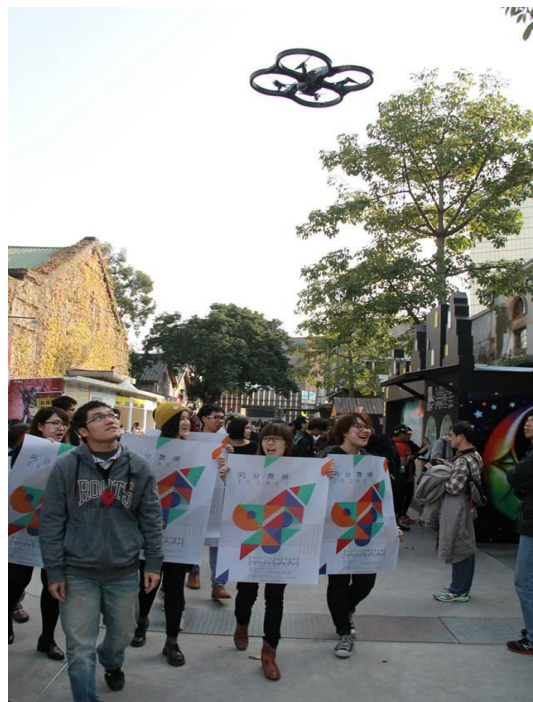
協同業師來展參觀